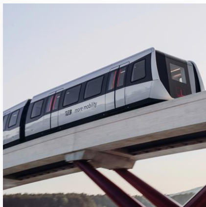
Mobilność i Transport