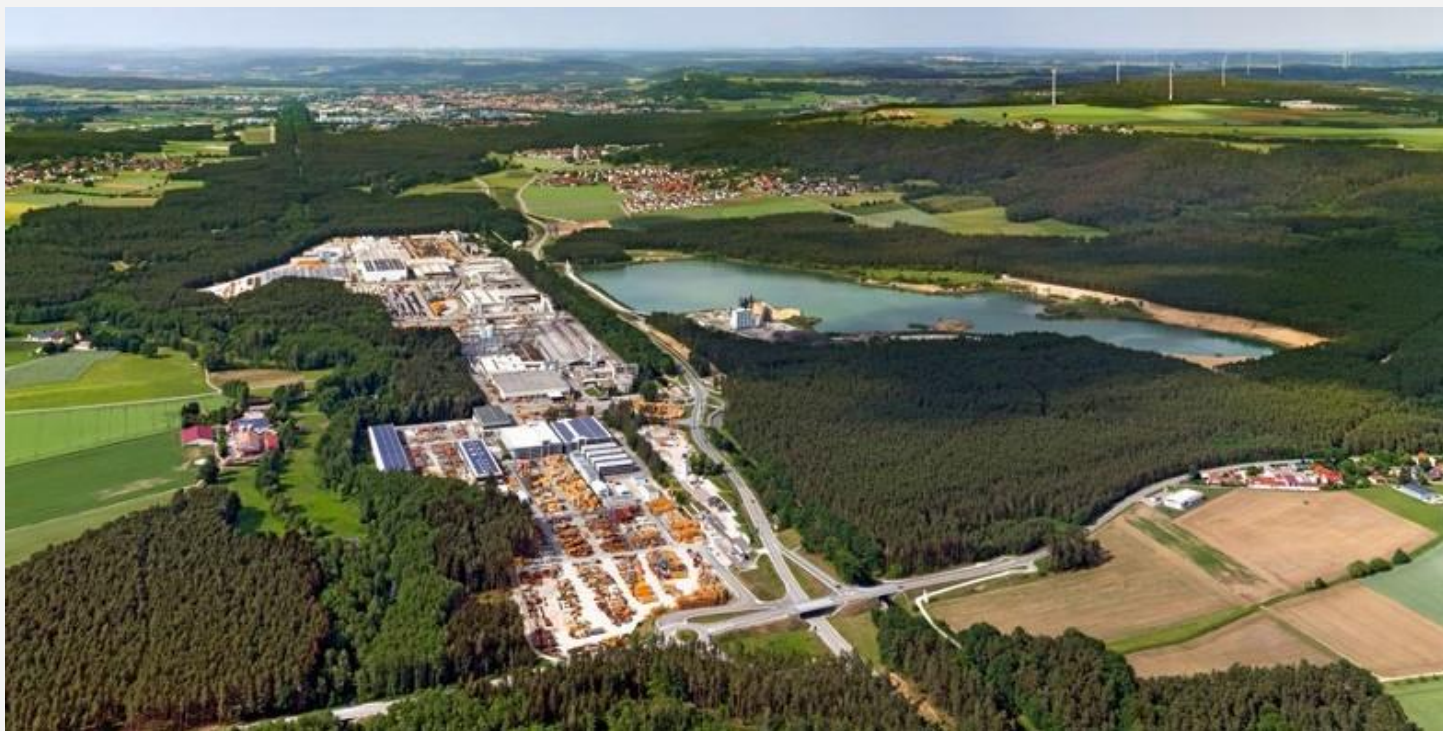
Główna siedziba firmy, Sengenthal k. Norymbergi